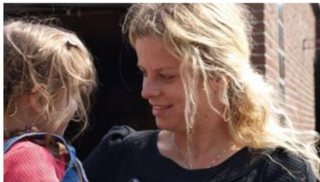
Kim Clijsters, ambassadrice sinds 2010