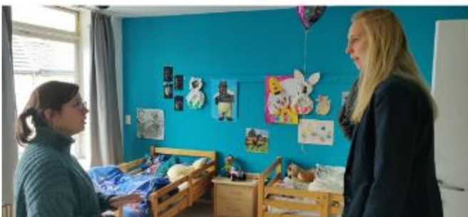
Basketbaltopper An Wauters op bezoek in het Simbahuis

www.sos-kinderdorpen.be/verhalen?category=10