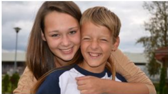
Uithuisplaatsing? Hou broers en zussen samen! Beleidswerk in België