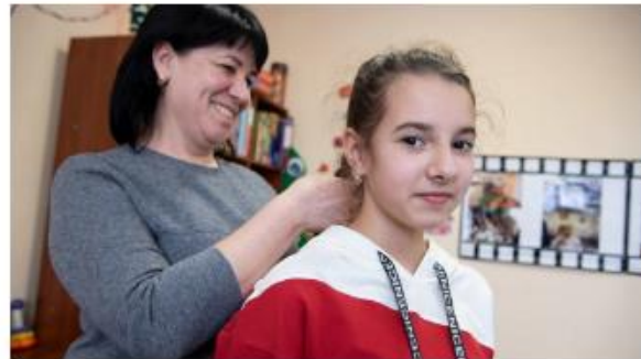
Professionele nabijheid: inspireren tot zorg vanuit het hart Beleidswerk in België