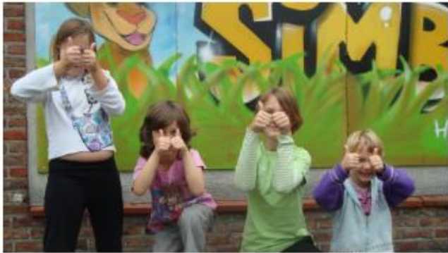
De Simbahuizen België

https://www.sos-kinderdorpen.be/projecten