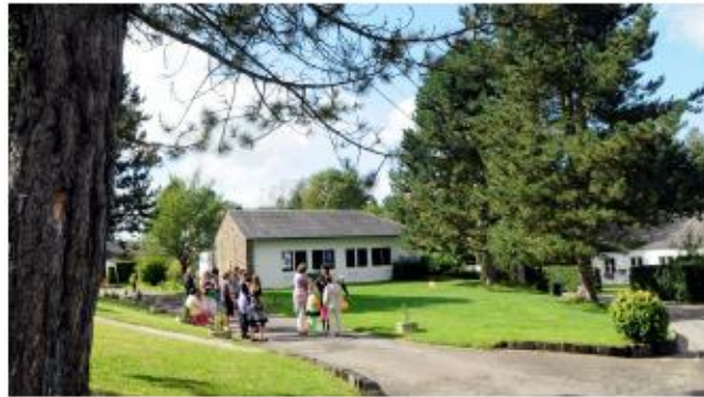
Het SOS Kinderdorp Chantevent België