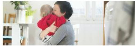
Introductie van professionele zorgouders in de jeugdzorg Beleidswerk in België