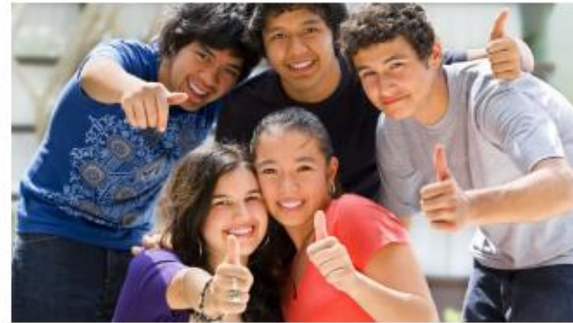
Opvanghuis Hejmo België